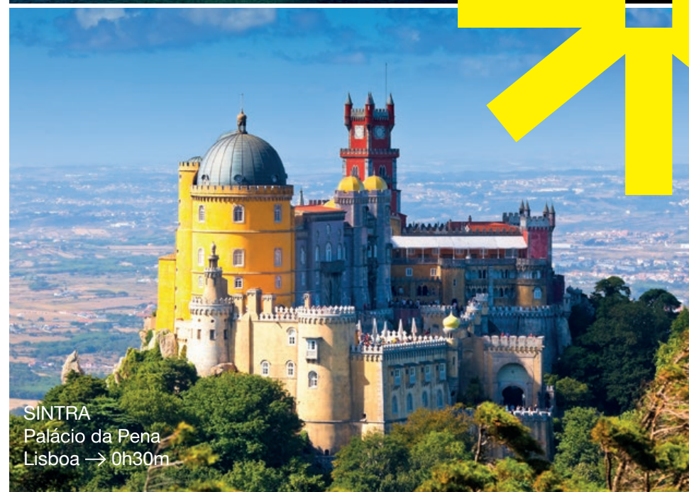
SINTRA Palácio da Pena Lisboa → 0h30m