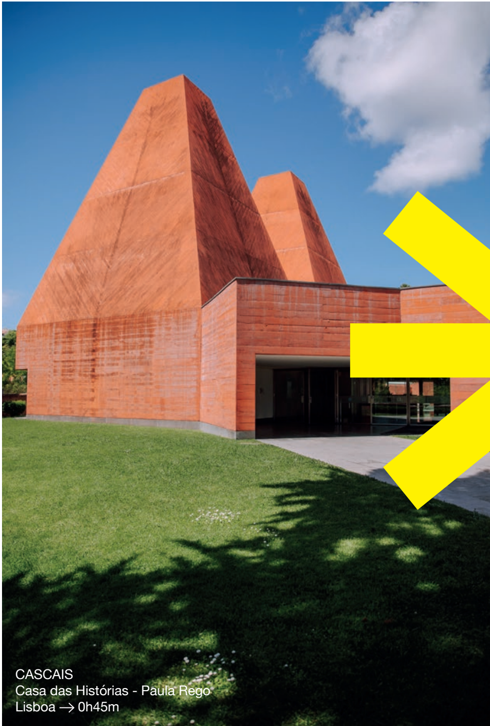
CASCAIS Casa das Histórias - Paula Rego Lisboa → 0h45m