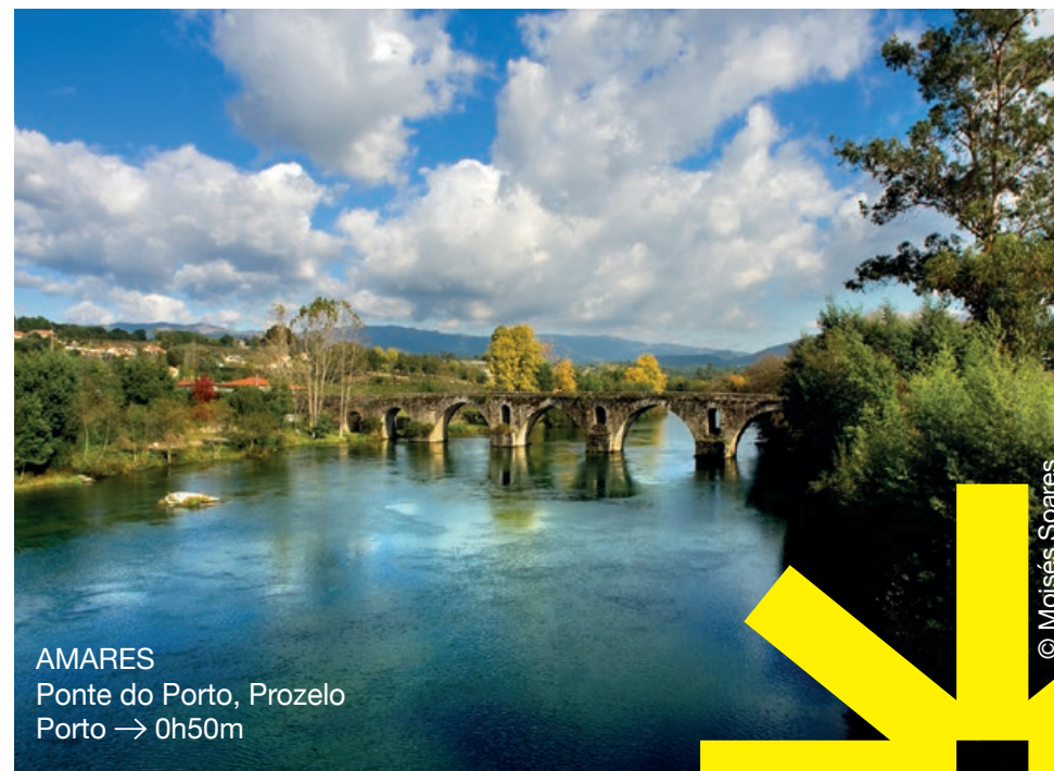
AMARES Ponte do Porto, Prozelos Porto → 0h50m