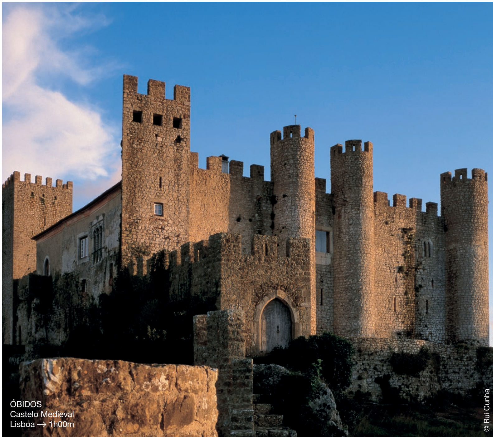
ÓBIDOS Castelo Medieval Lisboa → 1h00m