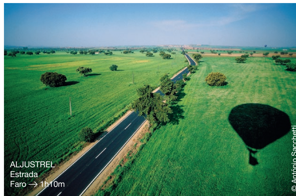
ALJUSTREL Estrada Faro → 1h10m