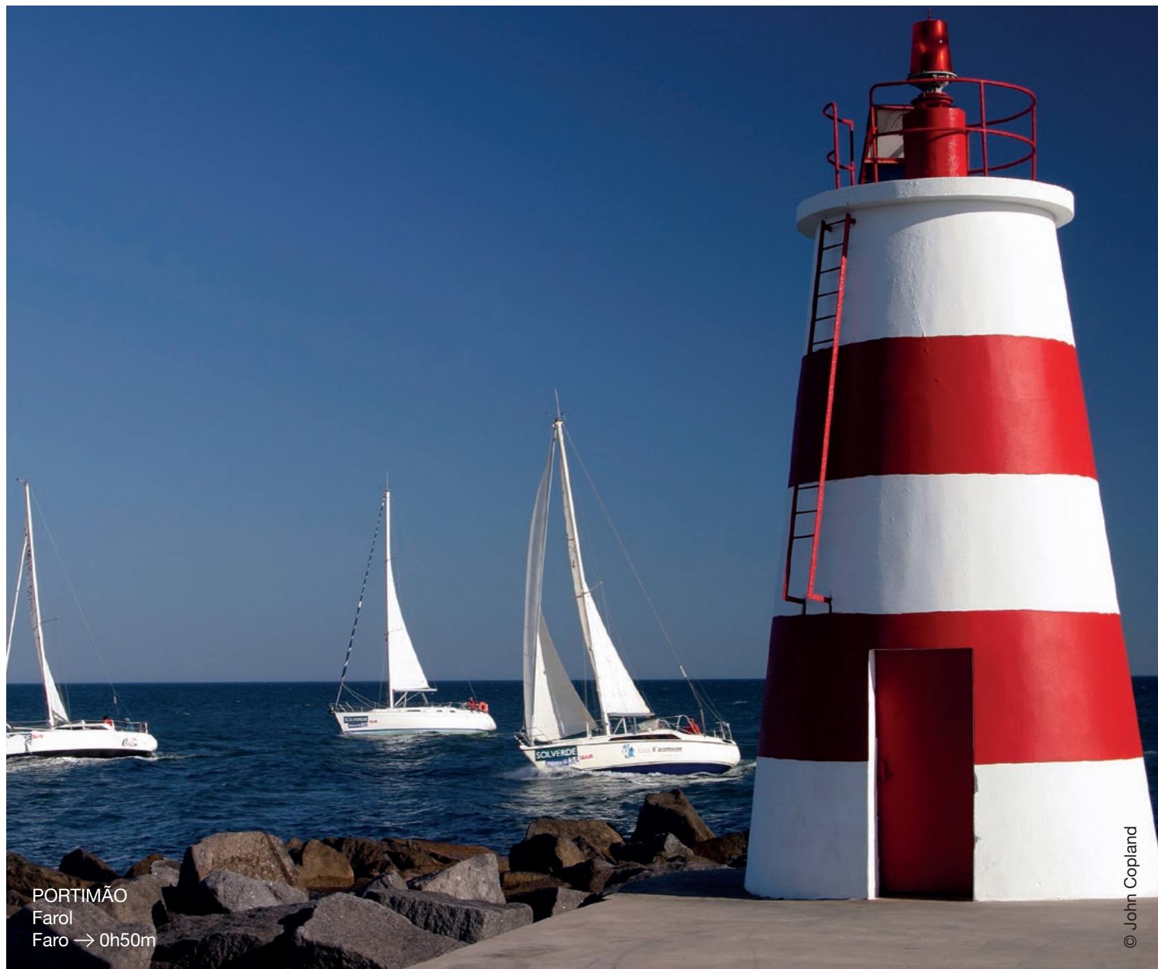
PORTIMÃO Farol Faro → 0h50m

Viana Film Commission cm-viana-castelo.pt