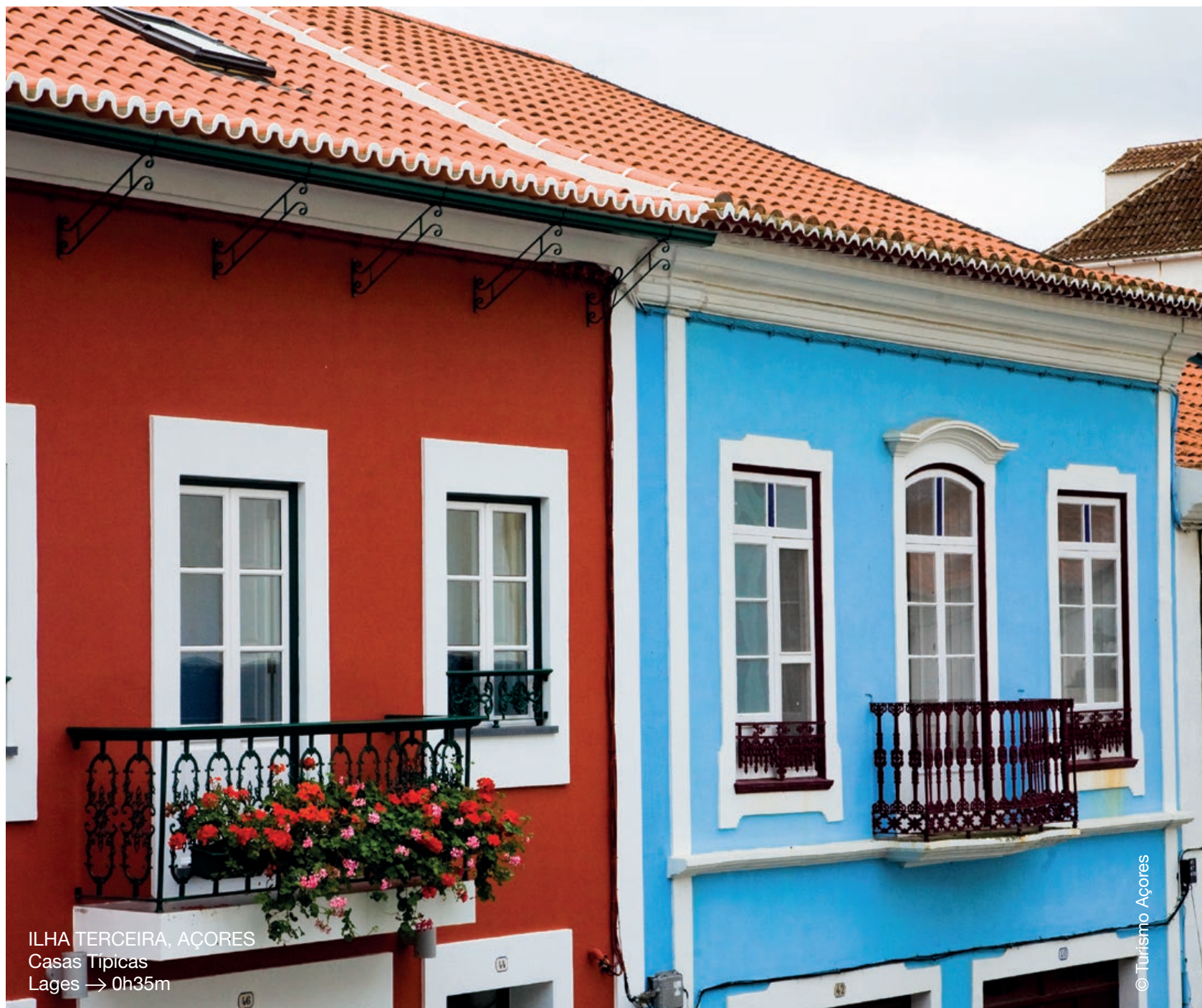
ILHA TERCEIRA, AÇORES Casas Típicas Lages → 0h35m

→ Instalações, estúdios e equipamentos dotados com a mais recente tecnologia. Existem ainda projetos para desenvolvimento de novas instalações.