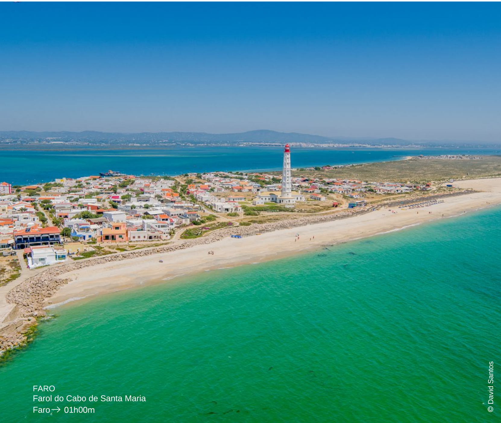
FARO Farol do Cabo de Santa Maria Faro → 01h00m