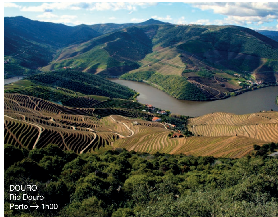
DOURO Rio Douro Porto → 1h00

Região Autónoma dos Açores portal.azores.gov.pt/web/drturismo